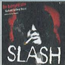
Slash Die Autobiographie

Die Urgroßväter der Rock-Aristokratie schufen Epen, eroberten den goldenen Westen und pflegten dabei einen Lebensstil wie Louis XIV und Dschingis Khan zusammen. Uwe Ochsenknecht schafft es, in 210 Minuten die ultimative Saga des Rock mit einem erstaunlichen Detailreichtum und auf absolut mitreißender Weise zu erzählen. (phi)