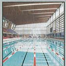
Good Shoes No Hope, No Future

Dis is veeeeeery British, my dear: Die vier Londoner haben verstanden, was derzeit die Indie-Tanzflächen zum Kochen bringt. Fixe Beats, die sich fast überschlagen, ein nasal genöhlter, kunstvoll auf lakonisch getrimmter Gesang und ein Sound, als ob der Bass-Speaker ausgefallen ist. Aber: gute Songs. Hippe Scheiße, Dude! (skr)