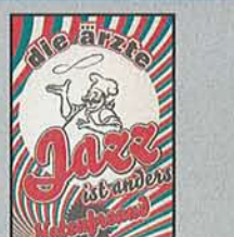
Die Ärzte Jazz ist anders: Notenfreund

Ja, der gute Slash hat's verdammt noch mal krachen lassen. Und zwar (fast) so smart und verschmitzt, wie er sich seit über zwanzig Jahren hinter Locken, Sonnenbrille und Zylinder in Szene setzt. Die ausgesprochen reflektierte und hochspannende Geschichte wird hier von Ingo Naujok entsprechend verwegend vorgetragen. (phi)