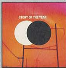
Story Of The Year The Constant

Niemand verzahnt Punk, epischen Bombast und puren Pop so geschickt, ohne dabei in Emo-Gewässer abzudriften, wie Story Of The Year. Die Amis schaffen es, gleichzeitig nach Stadion und Garage zu klingen und selbst in ihren stromlinienförmigsten Refrains auf platte Klischees zu verzichten. Ein Hybrid der angenehmeren Sorte. (mr)