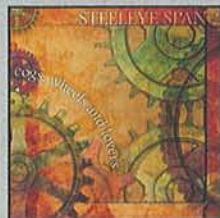
Steeleye Span Cogs, Wheels And Lovers