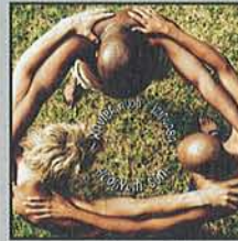
Xavier Rudd & Izintaba Koonyum Sun

Dem World-Music-Fan ist er längst ein Begriff. Nun greift Xavier Rudd nach den Sternen: Größere Melodien kann er im Reggae kaum geben. Da geht schon beim Zuhören die Sonne auf. Begleitet von einer brillanten Band zwischen Reggae, Ska und Karibischem, stecht hier Herz und Schmerz zu gleichen Teilen drin. (skr)