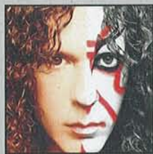
Marty Friedman Tokyo Jukebox

Aggressiv shreddert der einstige Megadeth- und Cacophony-Gitarrist Marty Friedman mit seinem unverkennbaren Ton auf diesem ursprünglich für Japan gedachten Album drauflos, wechselt zwischen Lärmpassagen und melodischen, ruhigeren Momenten, teils sogar in der Art Pariser Straßenmusiker. Ein Fest für Genre-Fans. (pro)