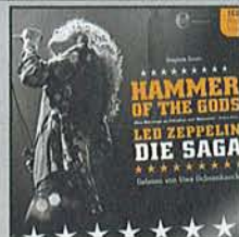
Led Zeppelin Hammer Of The Gods

40 Jahre, 21 Studioalben. Legende. Auf diesen Nenner ist die Karriere der britischen Folkrock-Pioniere Steeleye Span zu bringen. Diese Traditional-Neuinterpretationen reiht die heutige Besetzung um Maddy Prior und Rick Kemp beeindruckend ein in eine Kette kreativ-anspruchsvoller Werke, samt titellosem Hidden Track. (pro)