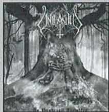
Unleashed As Yggdrasil Falls

Die Stockholmer Todesbleigießer widerlegen mal wieder das Vorurteil, Death Metal sei nur stumpfes Gebolze. 'As Yggdrasil Falls' verlässt nie die Genre-Grenzen, bietet aber eine beeindruckende Vielseitigkeit, die von extremen, gitaristisch anspruchsvollen Aggro-Eruptionen bis zu düster-erhabenem Edel-Pomp reicht. (mr)